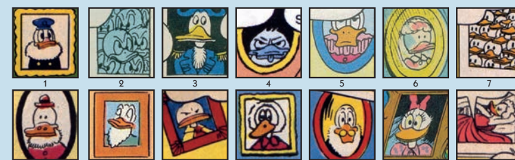
Bild 1 aus: Verhängnisvolle Erfindung MM 1-78 – WDC 73, Bild 2 aus: Der geizige Verschwender TGDD 85 – US 47, Bild 3 aus: Geld oder Ware MM 15-76 – WDC 99, Bild 4 aus: Noise Nullifier BLDO 25 – FC 263, Bild 5 aus: Weihnachten für Kummersdorf TGDD 140 – FC 367, Bild 6 aus: Der Schreckenshut MM47-60 – FC 1055, Bild 7 aus: Der Walzerkönig TGDD 97 – WDC 84, Bild 8 aus: Eine Party der peinlichen Art TGDD 110 – WDC 91, Bild 9 aus: Die fabelhafte Hasenpfote TGDD 101 – WDC 39, Bild 10 aus: Die fleißigen Ameisen TGDD 13 – WDC 170, Bild 11 aus: Donald, der Münzsammler TGDD 74 – WDC 50, Bild 12 aus: Rat einmal TGDD 98 – CP 2, Bild 13 aus: ???, Bild 14 aus: Das Radargerät TGDD 4 – WDC 60

Auch bei den hier vorgestellten Details könnte es Ansätze für weitere Forschungsarbeiten geben, den Porträts, die sich fast ausnahmslos an den Wänden von Donalds Wohnung befinden. Manchmal sind mehrere Köpfe zu sehen, es könnte sich dabei um Gruppenbilder oder auch abstrakte Kunst handeln. Zumeist jedoch sind nur ein oder zwei Personen dargestellt, in der hier abgedruckten Kollektion ausnahmslos Anatide, also Entenähnliche. Dem geneigten Leser wird vielleicht die Ähnlichkeit zwischen der Person im ersten Bild und dem aus „Weihnachten für Kummersdorf“ (FC 367, u. a. DDSH 3) bekannten Jakob Jungerpel auffallen, nach Donalds Aussage der Sippenälteste der Ducks. Das legt zumindest die Vermutung nahe, dass es sich bei der hier präsentierten Ansammlung ansehnlicher Charakterköpfe um Familienporträts handelt, was wiederum für die Duck'sche Stammbaumsforschung, einen der ältesten Forschungszweige des Donaldismus, interessant wäre. Ebenfalls sehr reizvoll ist die Frage, wer die Dame ist, die sich im letzten Bild so lasziv auf einem Kanapee räkelt, und in welcher Beziehung sie zu Donald Duck steht.